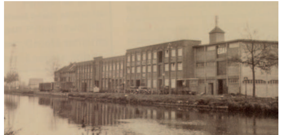
De 'thuisbasis' van EDAH aan de Kanaaldijk in 1928.