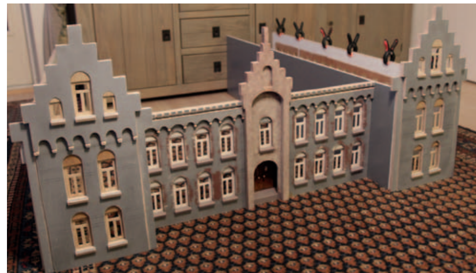
De voorgevel geeft al een beeld van de maquette. Zelfs de nis voor het beeld van de Heilige Antonius is al aangebracht.

al gedacht aan een reproductie van de Heilig Hartkerk en de voormalige pastorie aan de Watermolenwal. Zelfs het koetshuis van het kasteel dat in 1893 door brand werd verwoest staat op het programma. Om alle objecten een waardige plaats te geven, bouwde Gerrit in zijn achtertuin een bescheiden onderkomen. Deze is echter te beperkt om alle maquettes naar behoren te herbergen, daarom wordt naarstig gezocht naar een ruimte waar de creaties tot hun recht komen. Daarnaast wordt gedacht aan een expositie van het gehele oeuvre, die aan het eind van dit jaar zou moeten plaatsvinden. Wilt u zolang niet wachten, kijk dan alvast op het internet naar een video die van de juweeltjes werd gemaakt. Deze kunt u vinden op: http://nieuws.ditisonzewijk.nl/tag/kunst-en-cultuur/