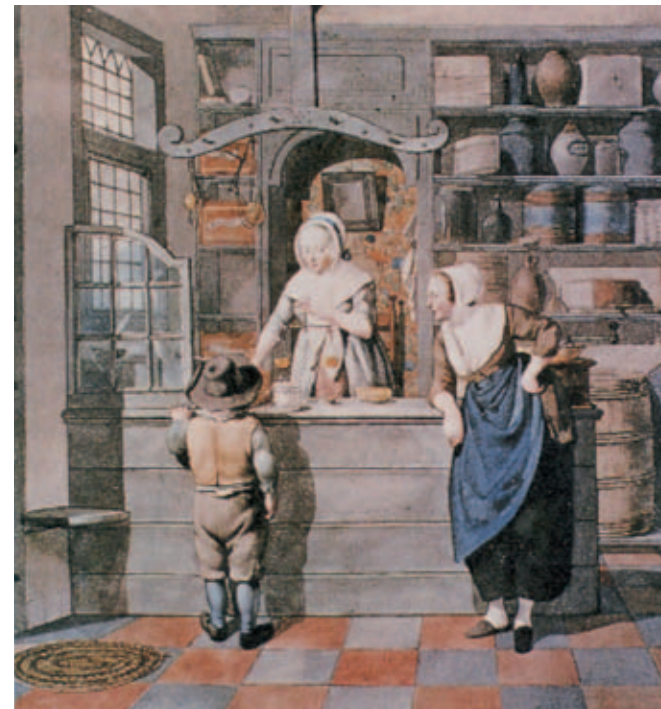
Kruidenierswinkel aan het einde van de achttiende eeuw. Aquarel van J.B. Prins

meer succes het hoofd kon bieden aan de concurrentie. Toen werden namelijk de rechten en beschermde posities van gilden; corporaties en broederschappen vervallen verklaard. Daarna kregen de kruideniers het wat gemakkelijker. Door de verstedelijking kwamen er steeds meer en een aantal ambachten verdween