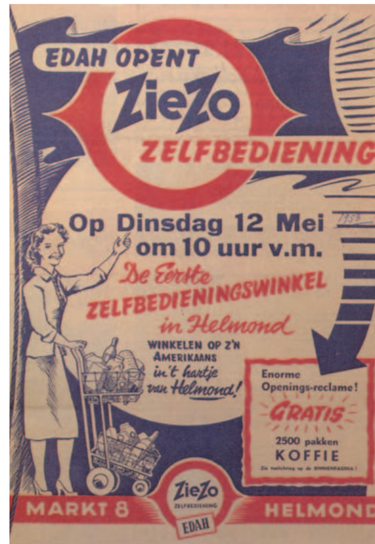
Reclame voor de eerste supermarkt in Helmond. De advertentie belooft 'winkelen op z'n Amerikaans'.

De jaren zestig en het begin van de jaren zeventig waren revolutionair voor de kruideniersbranche en in 1969 werd een begin gemaakt met de omschakeling naar de "discount formule". Dat was ook weer een groot succes en EDAA groeide, direct na Albert Heijn, uit naar de tweede plaats in de distributie van levensmiddelen in Nederland.