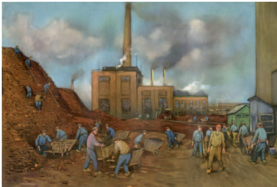
Pasteltekening van de turfhoop op het fabrieksterrein van Vlisco in 1946. (Illustratie J. Pander)

zien. Daar moest brand zijn uitgebroken. Achteraf bleek die rook afkomstig te zijn van een vernielde tank met salpeterzuur op het spoorwegemplacement. Op dat moment sproeide de sprinklerinstallatie bij Carp omdat een der buizen een treffer had gekregen. Maar ondertussen werd ook de turfhoop bij Vlisco in brand geschoten. Daar lag namelijk een flinke turfhoop. Omdat steenkool tijdens de oorlog schaars was had het bedrijf besloten om op grote schaal turf te winnen in Helenaveen. De opzichter ging met enkele brandwachten snel op de brand af om die te blussen. Meteen na de eerste straal water dook er bleek van schrik een Duitse soldaat op. Maar die bleke kleur sloeg meteen om in een rode kleur van woede want de brandwacht had per ongeluk recht in de loop van het geweer van die verdekt opgestelde soldaat gespoten. Volgens ooggetuigen