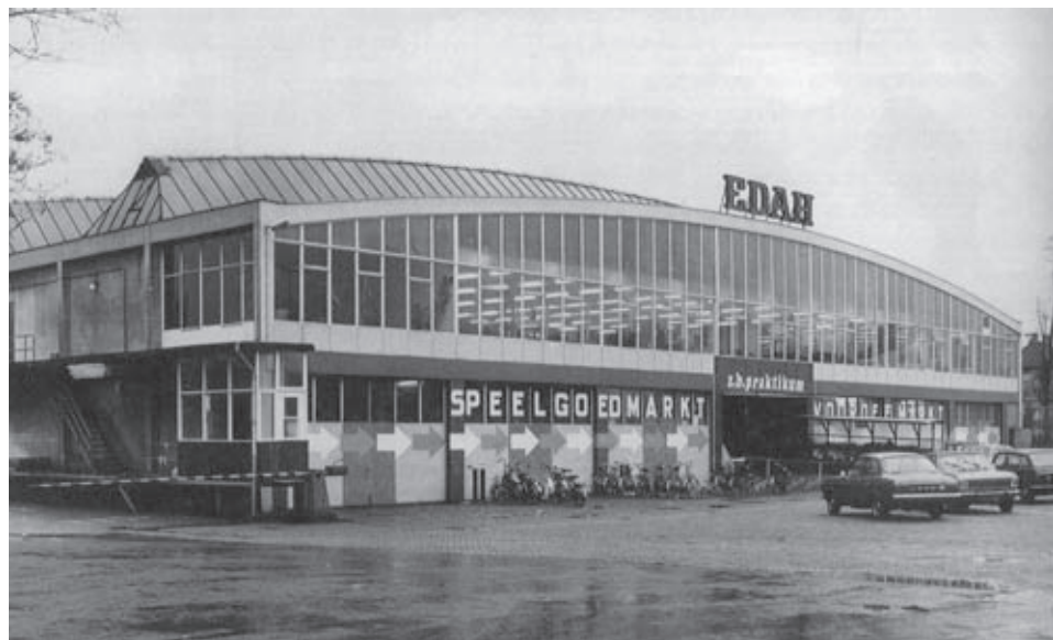
In 1975 werd het distributiecentrum verlegd naar Hoogeveen. Daardoor kwam er in Helmond ruimte vrij voor de EDAH Praktikum (later Torro). Deze hal werd de ‘Pannekoekhal’ genoemd.