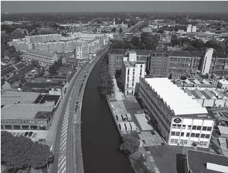
Luchtfoto van de huidige situatie rond de Vlisco, het kanaal en Boscontondo

niet opvallend, maar wel regelmatig even een kijkje ging nemen in zijn huis, bracht een heerlijke traktatie mee in de vorm van een doosje Ademin van Klene, dat eigenlijk bestemd was om de hoestbuien van zijn klanten in de herfst en de winter te stillen. In verband met het grote aantal Duitsers dat inmiddels in de fabriek was en met de veiligheid van de nachtstokers wilde de opzichter, de heer Ter Steeg de feldwebel te pakken zien te krijgen. Toen hij echter bij de turfhoop aankwam zag hij alleen een heleboel ruggen van Duitsers. Zij stonden allemaal gespannen door de schutting te loeren en hadden geen tijd en geen aandacht voor hem. Eén Duitser klampte hem even later aan om de sleutels te krijgen van de