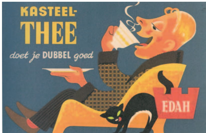
Een van de huismerken van EDAA heette Kasteelthee. Waar de inspiratie voor deze naam vandaan kwam is wel duidelijk.