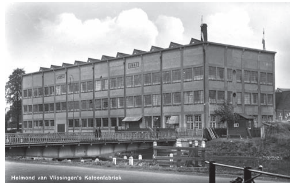
Ansichtkaart van 'gebouw 1911' dat onder andere diende voor de opslag van walsplaten.